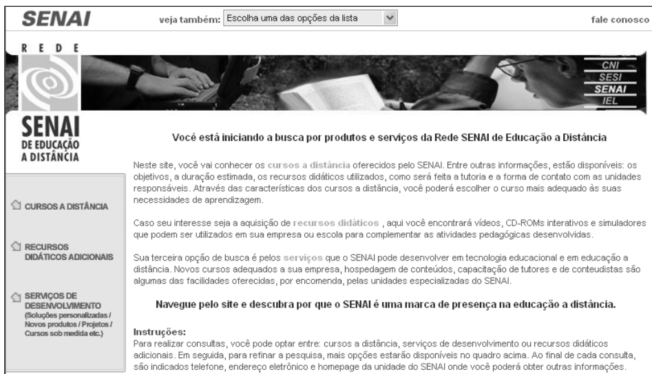
Figura 2: Portal de la Rede SENAI de Educação a Distância: http://www.senai.br/ead/

período 2005-2006, la actualización tecnológica en las áreas de metal-mecánica, electro/electrónica y construcción civil fue posibilitada por la utilización de educación a distancia, alcanzando a tres mil docentes. En el 2007, nuevos contenidos de metal-mecánica y del área de alimentos y bebidas serán ofrecidos para docentes por medio de cursos a distancia desarrollados por la propia institución. Con un grupo en 2006 y otro en 2007 más de dos mil profesionales del SENAI que prestan servicios técnicos y tecnológicos para las empresas estarán participando en una capacitación on-line, complementada por talleres presenciales.