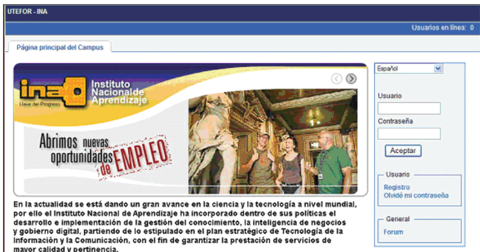
Figura 5: Sitio web UTEFOR del INA

En la modalidad de “blended learning” se han graduado desde el año 2004 hasta el 2006 unas seis mil personas y se ha proveído formación a un entorno de 20 empresas en modalidad de formación corporativa avalada por el INA. En muchas de estas empresas la formación se brinda como educación continua por lo que la capacitación se extiende a lo largo de todo el año.