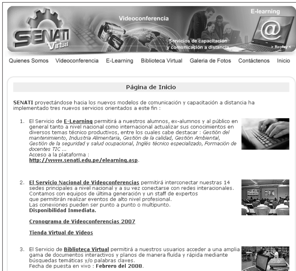
Figura 9: SENATI Virtual. http://www.senati.edu.pe/vc/inicio.htm